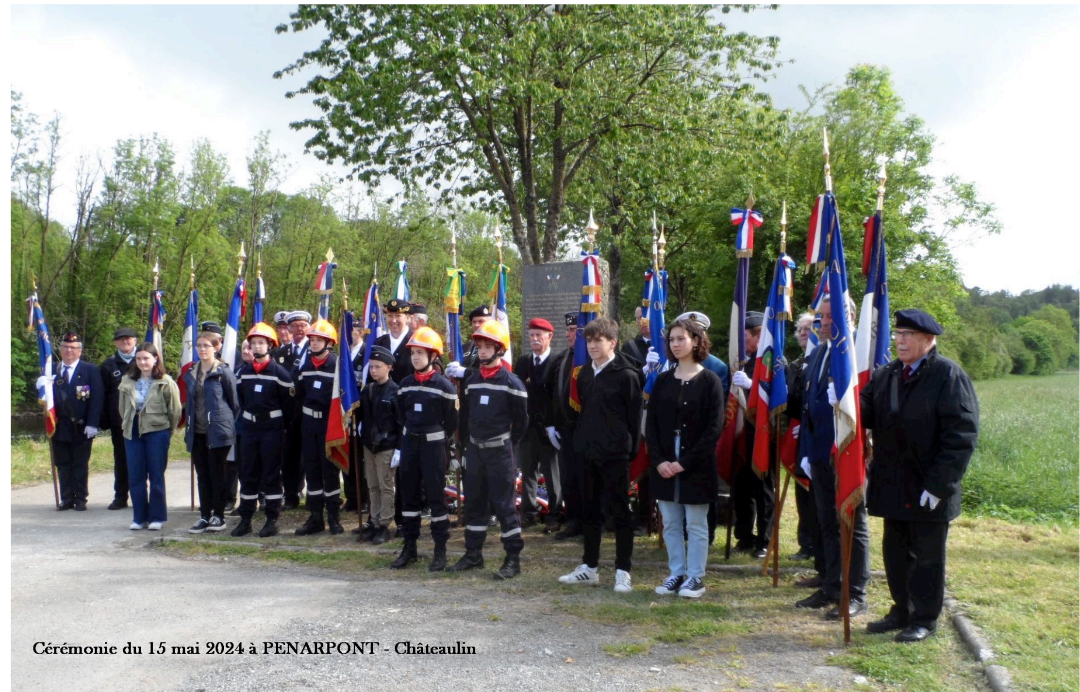
Cérémonie du 15 mai 2024 à PENARPONT - Châteaulin