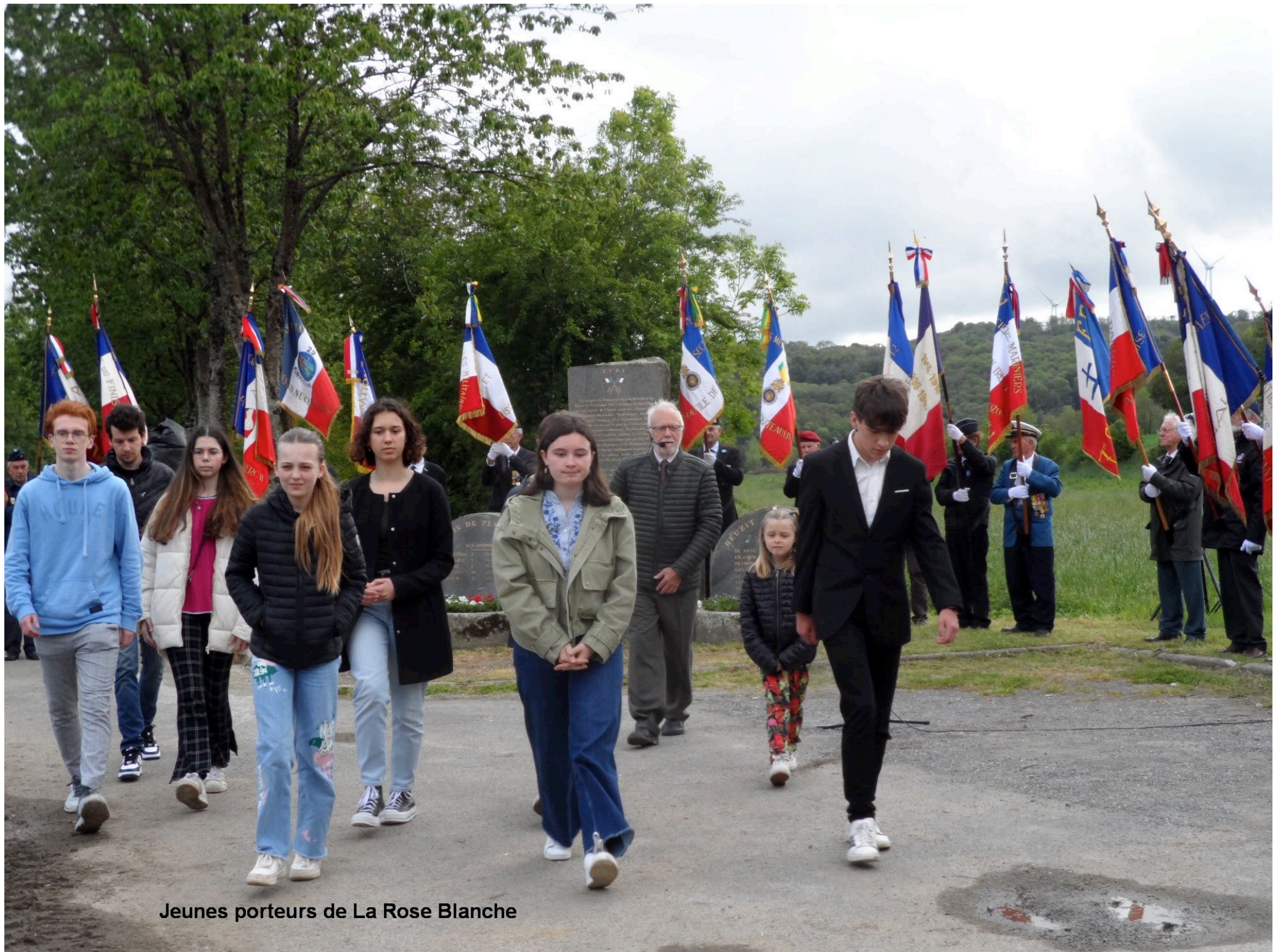
Jeunes porteurs de La Rose Blanche