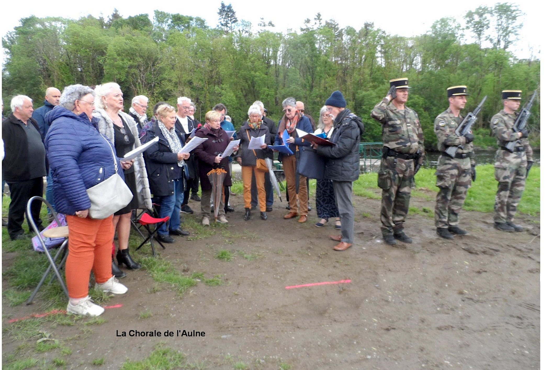
La Chorale de l'Aulne