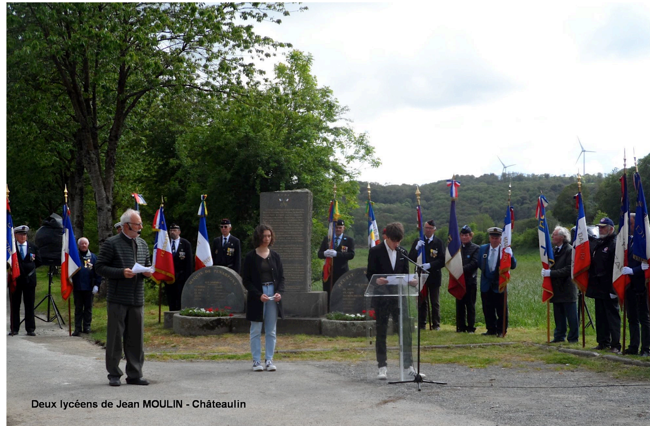
Deux lycéens de Jean MOULIN - Châteaulin