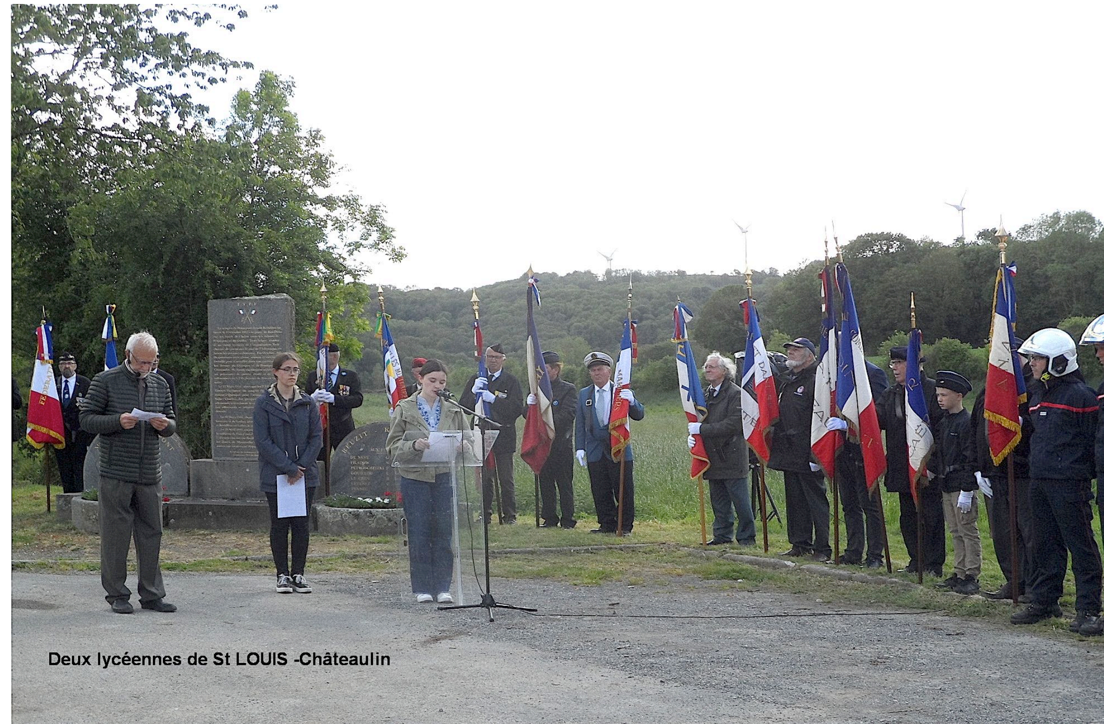
Deux lycéennes de St LOUIS -Châteaulin