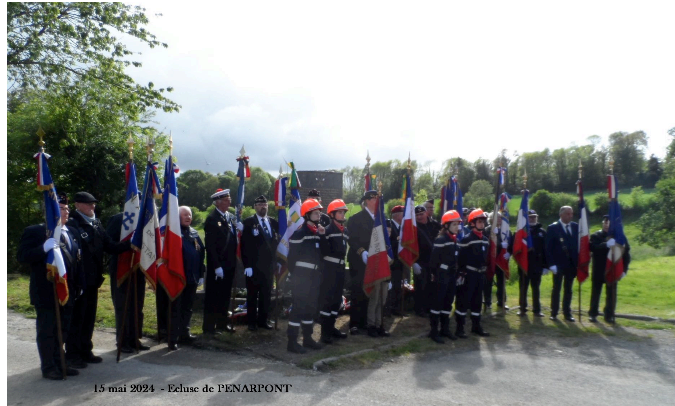
15 mai 2024 - Ecluse de PENARPONT