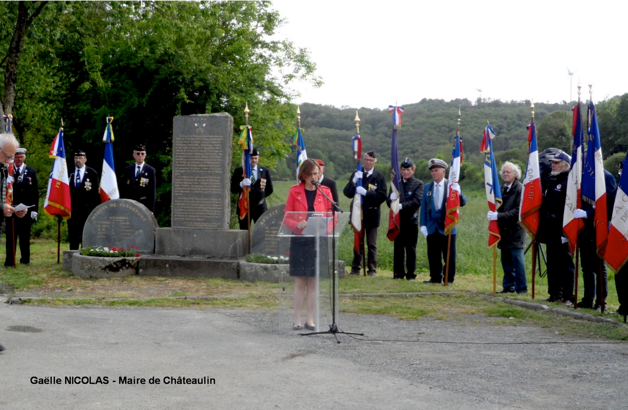
Gaëlle NICOLAS - Maire de Châteaulin