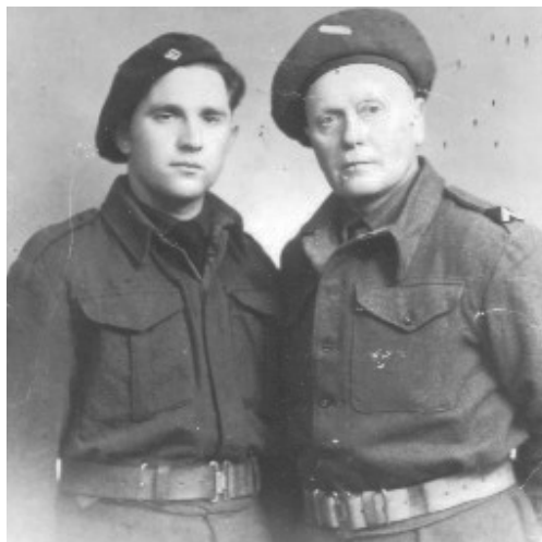
Père et fils avait le sens de l'engagement pour la Nation

Toute l'équipe du journal adresse ses condoléances attristées à son épouse ainsi qu'à toute la famille pour la disparition d'un être cher.