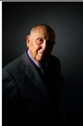
Daniel Cordier, juin 2014, Paris